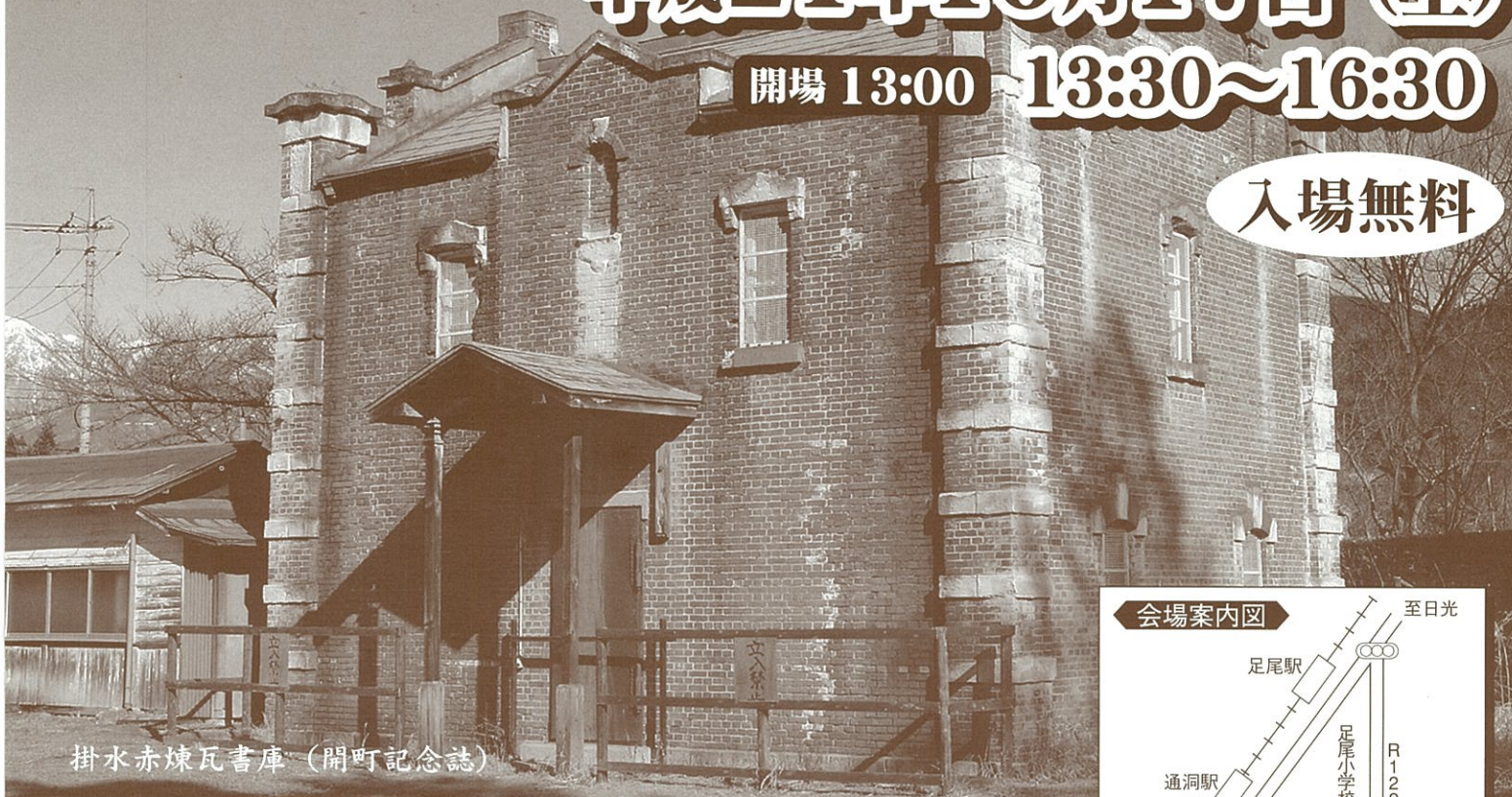
掛水赤煉瓦書庫 (開町記念誌)